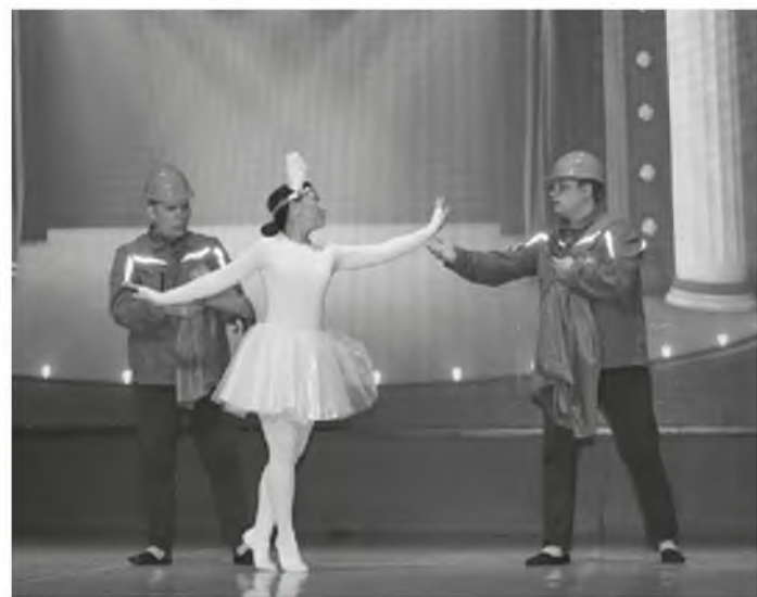
Топкинцы «внедрили культуру»