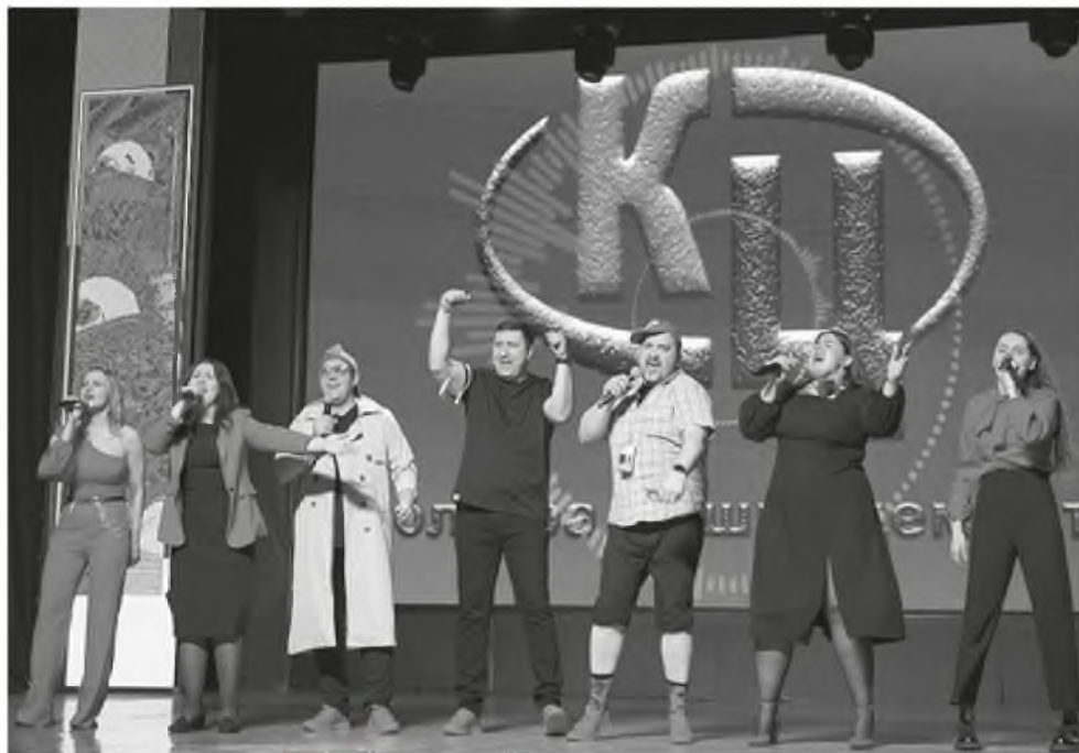
Команда-победитель КВН из Красноярска. Дома и стены помогают