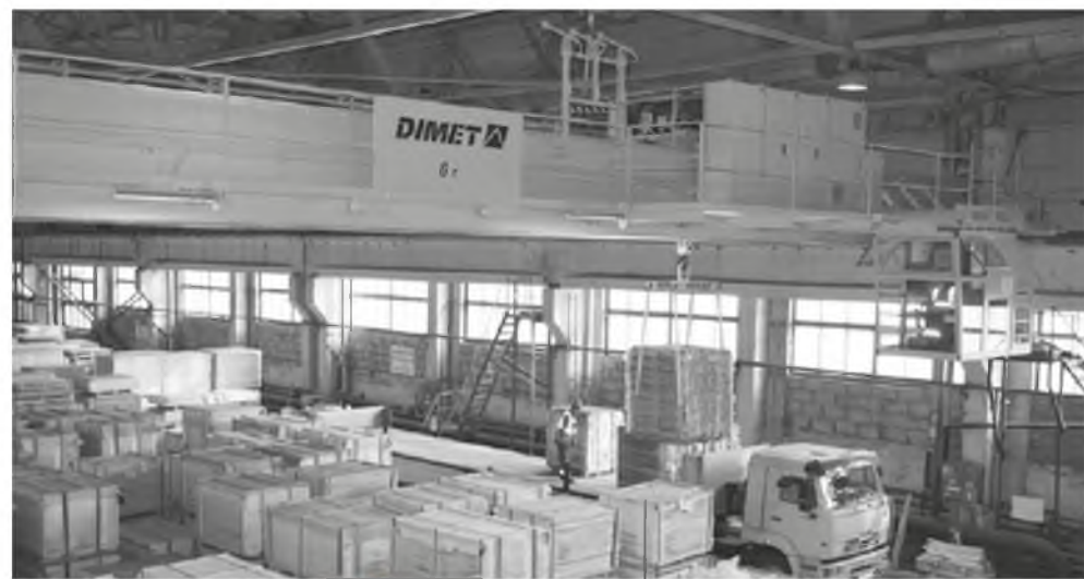
Мостовой кран – отличное приобретение к строительному сезону

В цехе нанесения покрытий комбината «Волна» запустили в эксплуатацию новый мостовой двухбалочный кран. Современное оборудование позволило отказаться от использования последнего на предприятии советского аналога-пятитонника.