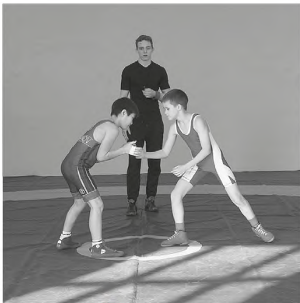
▲ Греко-римская борьба – для тех, кто стремится стать сильнее