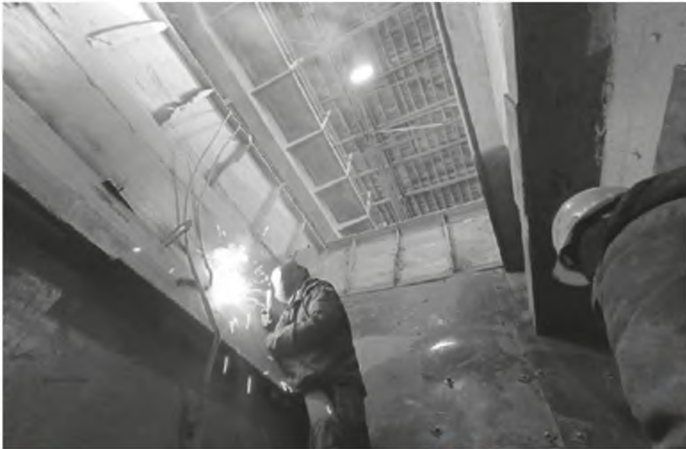
Идут работы в бункере

В цементном отделении цеха «Помол» ООО «ТимлюйЦемент» завершается плановый ремонт цементной мельницы № 8.