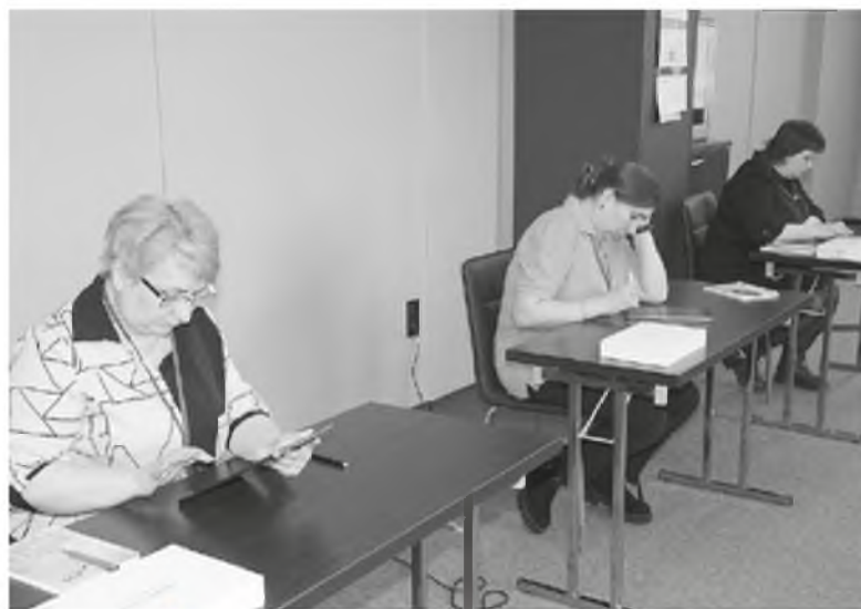
В этом году изменился формат профессиональной части конкурса