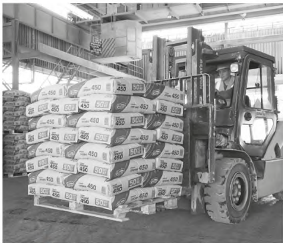
▲ Этот портландцемент применяется в основном в жилищном строительстве

С 1 февраля ООО «Красноярский цемент» отгружает потребителям новый в ассортименте предприятия вид продукции в мешках по 25 и 50 кг.